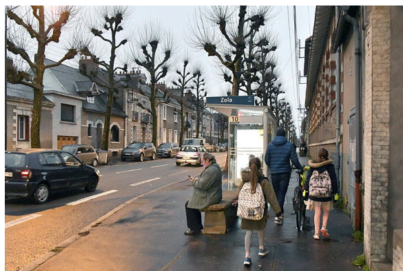
Devant l'école de la Fraternité (après)