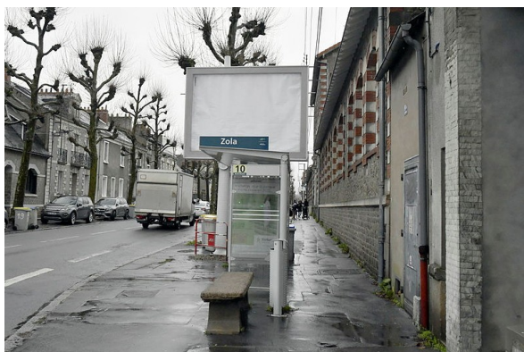
Devant l'école de la Fraternité (avant)