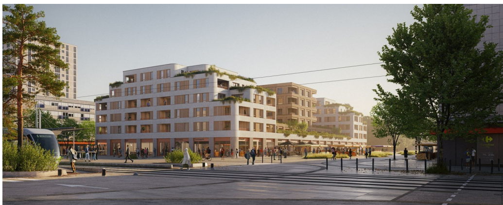
Future place Mendès-France

L'enjeu est de créer une vraie centralité, d'ouvrir la place et de contribuer à une meilleure qualité de vie : mieux se déplacer et se loger, accéder à des commerces mieux installés et organisés, accueillir des nouvelles activités économiques tout en maintenant le marché populaire dans de meilleures conditions. La future place sera plus végétalisée. Enfin, les deux villes travaillent sur la question essentielle de la sécurité, pour une place plus apaisée.