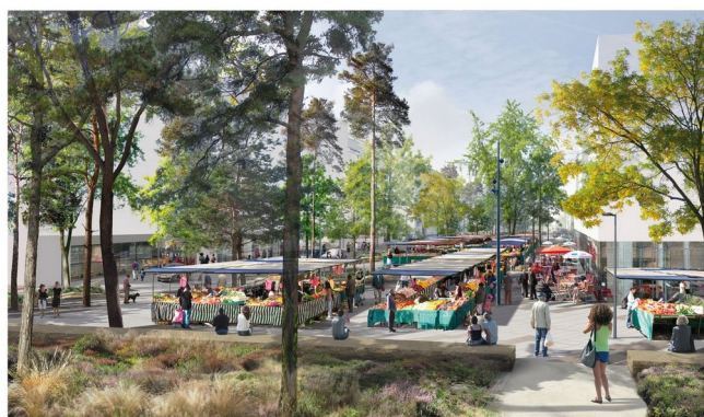
Le futur marché place Mendès-France

2023 marque le lancement des travaux sur la place Mendès-France, véritable trait d'union entre Nantes et Saint-Herblain et cœur du quartier. Il s'agit d'une étape symbolique du projet du Grand Bellevue (plus de 350 M€ d'investissement). Ce grand projet urbain vise à améliorer concrètement le quotidien des habitantes et habitants dans tous les domaines : emploi, développement économique, sécurité, commerces de proximité, santé, éducation, culture, nature en ville, transition écologique, sport ou vie associative.