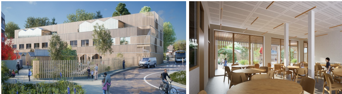
Vue depuis la rue des Bourdonnières et restaurant scolaire

La nouvelle école du quartier Nantes Sud prendra place sur l'ancien parking-relais des Bourdonnières. Elle sera construite avec des éléments en structure bois assemblés sur place, démontables et réutilisables. Outre ces vertus environnementales, elle combinera qualité d'accueil pour les enfants et qualité architecturale. Il s'agira de la 3 ème école sur le quartier Nantes Sud. Son ouverture permettra de rééquilibrer les effectifs dans les 2 autres écoles, Ledru-Rollin / Sarah-Bernhardt et Jacques-Tati. Son implantation au sud du quartier permettra une scolarisation de proximité pour les familles habitant dans le sud du quartier. Par ailleurs, la Ville poursuit sa réflexion pour la construction d'une école sur le plus long terme, dans ce quartier à la démographie dynamique.