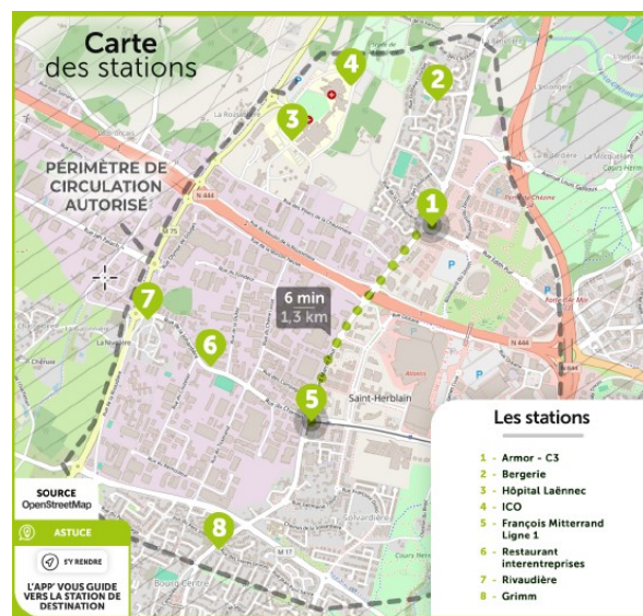
Carte du périmètre pour Saint-Herblain

Les vélos et trottinettes sont localisés par des puces GPS afin d'éviter les tentatives de sortie du périmètre. Dans le cas où l'utilisateur sortirait du périmètre de circulation des véhicules, il est prévenu par SMS ou notification de l'opérateur. Les vélos et trottinettes sont empruntés et rendus dans des stations légères et non électrifiées définies, mises à disposition par périmètre.