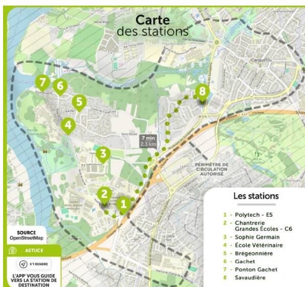
Carte du périmètre pour la Chantrerie