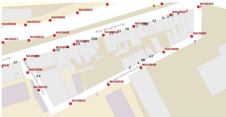
Représentation schématique de l'emplacement des point lumineux