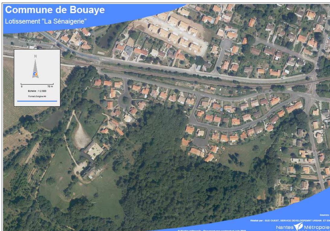
Vue aérienne de l'opération

- La parcelle cadastrée section AI n° 242, constitutive de la rue de la Quintefeuille a une surface de 1 256 m 2 . Elle prend naissance rue de la Sénagerie et se termine en impasse en forme de boucle. La longueur de la voie est d'environ 107 mètres pour une largeur d'environ 5,00 mètres. Il s'agit également d'une voirie simple avec des trottoirs de chaque côté. Elle dessert des habitations réalisées dans le cadre du lotissement. Cette voie est équipée de mâts d'éclairage.