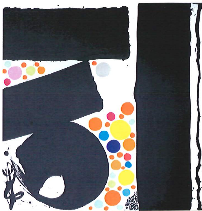
Temporel© Lassaâd Metoui